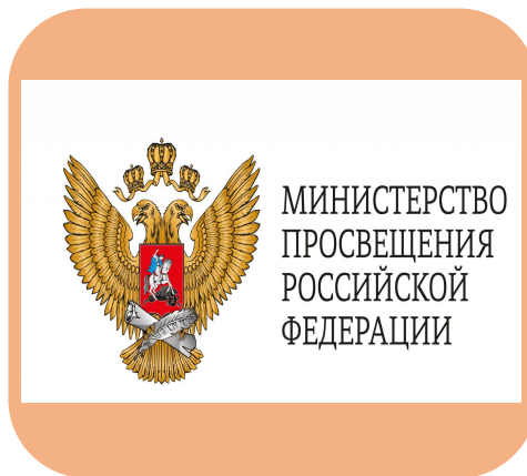
Региональные и федеральные органы надзорной власти