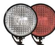
фары на СИМ